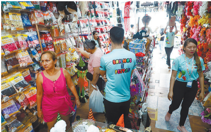
O Dieese projeta 6,8 mil vagas temporárias a serem preenchidas em 3 meses