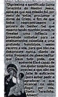
"Digníssima e santificada Santa Teresinha do Menino Jesus, sabe-se que sua missão foi, por meio de todas, proclamar o nome de Cristo, a fim de que todos reencarnassem a palavra do Senhor. Sei que mesmo tendo morrido jovem, tu deixaste uma infância e juventude voltadas para os ensinamentos celestiais e uma profunda humildade, assim recurso a vós, para que não me desampare nunca diante de uma fraqueza da desacreditar que Deus tudo pode, que sempre dá graças de me ajudar naquilo que preciso e que não me falta lá suficiente para saber pedir e agradecer o que alcanço na vida. Rogo, por nós, Santa Teresinha, Amém!"

MÃE RAINHA URBANISMO – CNPJ 04.487.622/0001-47 Torna público que requereu à AGENCIA MUNICIPAL DO MEIO AMBIENTE – AMMA de Sobral, a Licença de Operação de Regularização (LOR) referente à atividade de extração de sabão com uma área total de 11,7 ha, situada na localidade da Fazenda São Camilo (Av. Pimentel Gomes sentido periferia), Zona Rural, no Município de Sobral - CE. Foi determinado o cumprimento das exigências contidas nas Normas e Instruções de Licenciamento da AMMA.