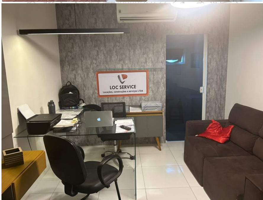
Imagem 06 e 07 – Av. Coronel Cicero Sá, nº 1930/Sala 04, CEP: 61.762.360, Eusébio – CE Data Visita: 30/07/2025

PREFEITURA MUNICIPAL DE BOA VIAGEM - CE.