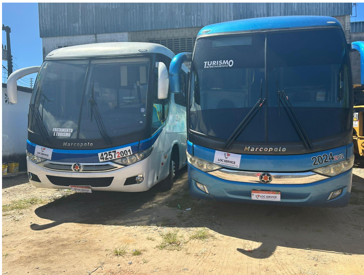
Imagem 01 a 05 - Av. Coronel Cicero Sá, nº 1930/Sala 04, CEP: 61.762.360, Eusébio – CE Data Visita: 30/07/2025