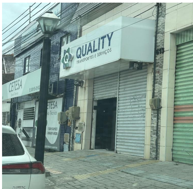
Imagem 01 – Fachada da empresa - Av. Professor Francisco Oscar Rodrigues, nº 613, Bairro Jereissati, Maranguape/CE – Visita – 04/08/2025