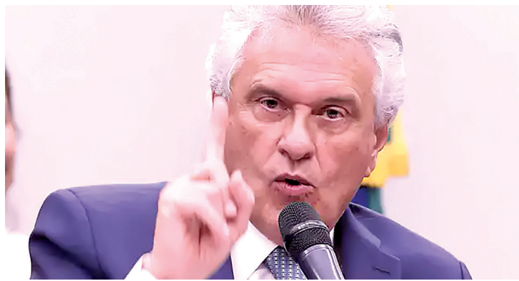
Caiado deixou o Governo de Goiás em março para se candidatar à Presidência