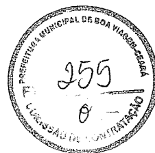
Artur Valle Pereira AGENTE DE CONTRATAÇÃO

Boa Viagem - Ce, 22 de Setembro de 2025.