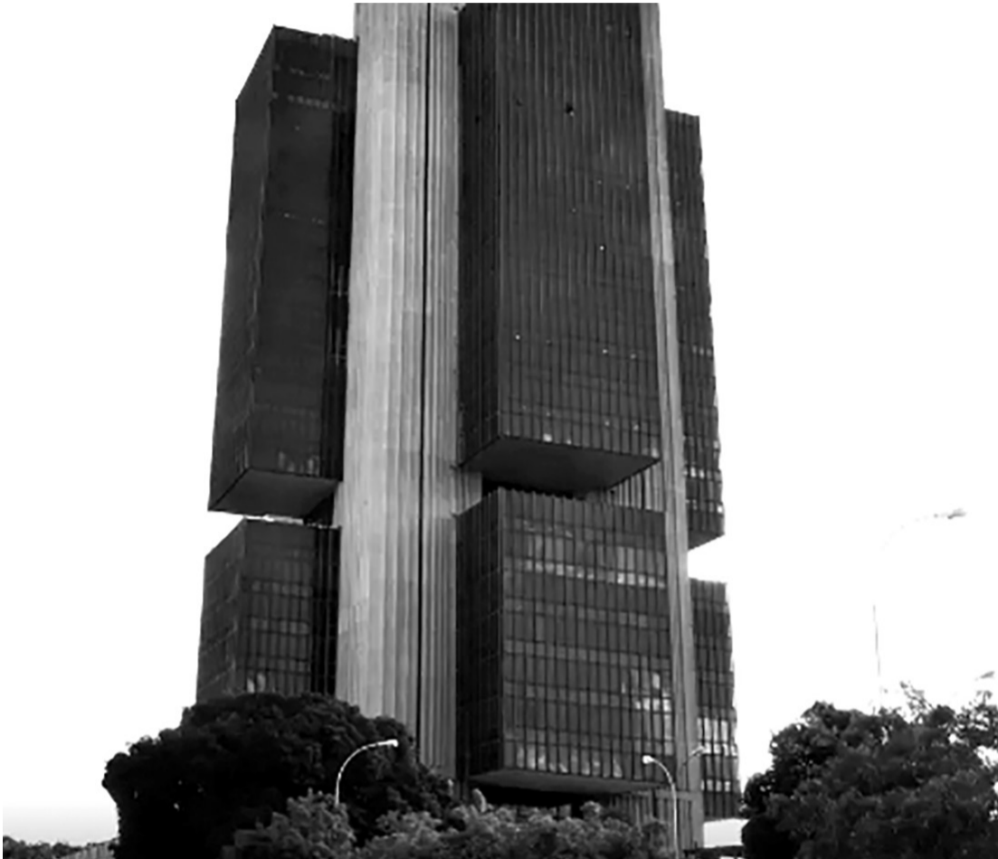
O BC concordou com a realização de uma inspeção para análise da documentação