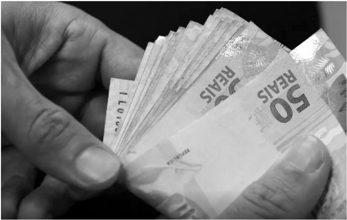
Para 2027, a projeção do BC há dez semanas é de inflação em 3,80%

Ainda conforme o IBGE, apesar o grupo habitação apresentou queda em dezembro, com recuo de 0,33%. Todos os demais grupos de produtos e serviços pesqui-