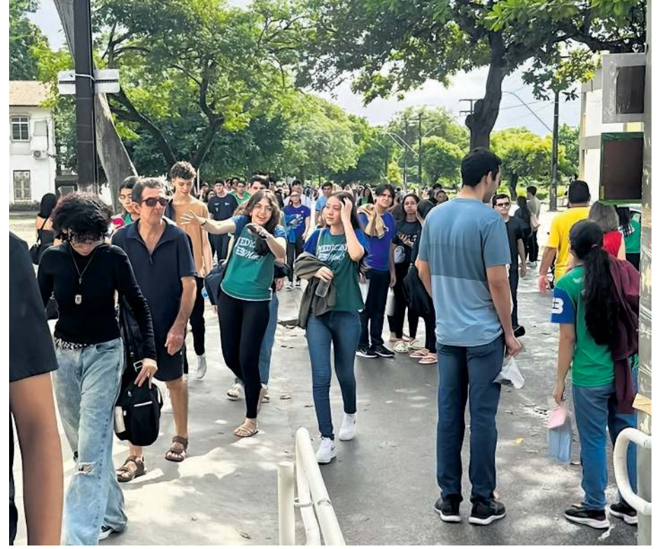
PROVAS da segunda fase do vestibular da Uece | 2025.2 transcorrem com tranquilidade

WILNAN CUSTÓDIO ESPECIAL PARA O POVO wilnan.oliveira@opovo.com.br