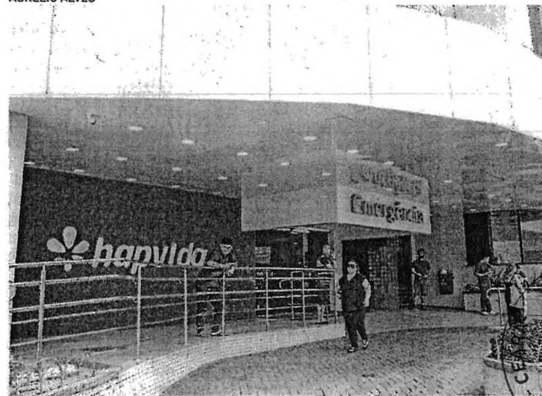
HAPVIDA é uma rede de saúde com sede em Fortaleza

A eleição do conselho de administração da companhia está marcada para ocorrer nesta quinta-feira, 30. O plei-