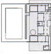
PLANTA CHAVE SEM ESCALA