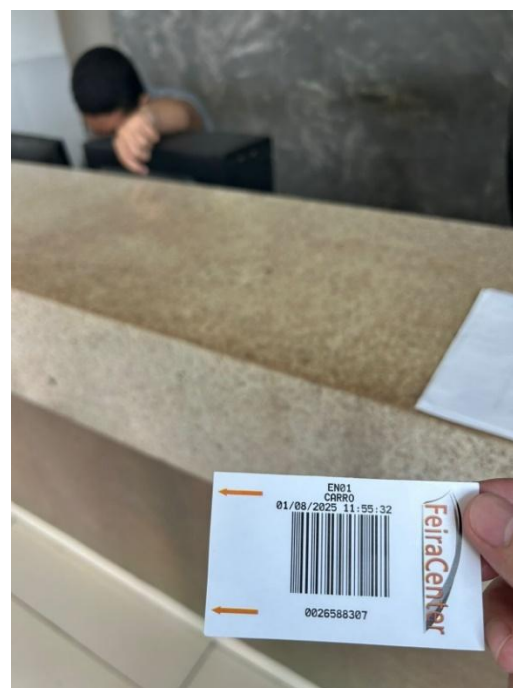
Imagem 02 e 03 – Registros de dentro do estabelecimento - (Avenida Yolanda Pontes Vidal Queiroz, 57, torre 1, andar 6, sala 607, Jereissati I, Maracanaú / CE) – Data Visita: 31/07/2025

As imagens acima foram registradas durante a diligência para comprovação das condições estruturais e operacionais da empresa.