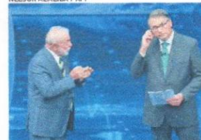
LULA e Bolsonaro em debate nas eleições de 2022