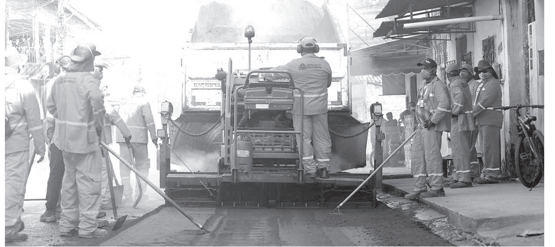
Regionais 1 e 2 da Capital recebem intervenções a partir de ontem

(Cagece). Esta última faz parte da nova fase do programa.