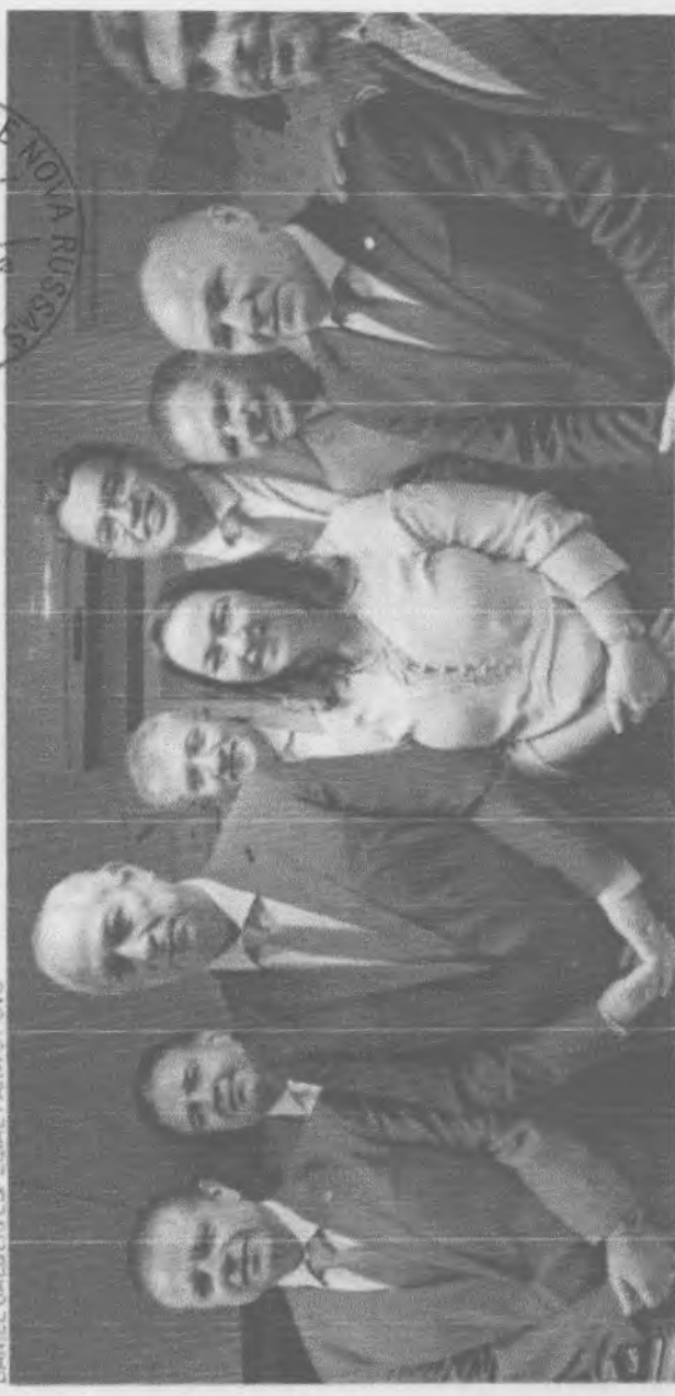
CIRO GOMES SE APROXIMOU DE BOLSONARISTAS NO CEARÁ