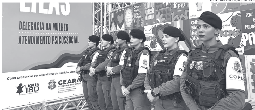
A Polícia Militar do Ceará conta com o apoio de 863 policiais militares, que atuarão no evento e nas imediações do local da festa

Com atuação ostensiva e preventiva os agentes farão a segurança do evento durante os quatro dias de folia