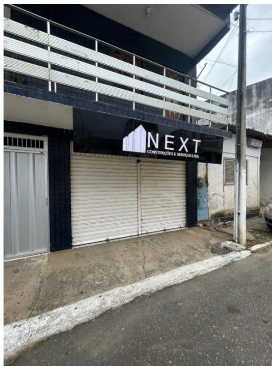
Imagem 04 - Visão geral parte externa da sede da empresa – (AV. São Cristovão, nº 190, Baixa Fria, Itapiuna – CE) – Data Visita: 30/07/2025

As imagens acima foram registradas durante a diligência para comprovação das condições estruturais e operacionais da empresa.