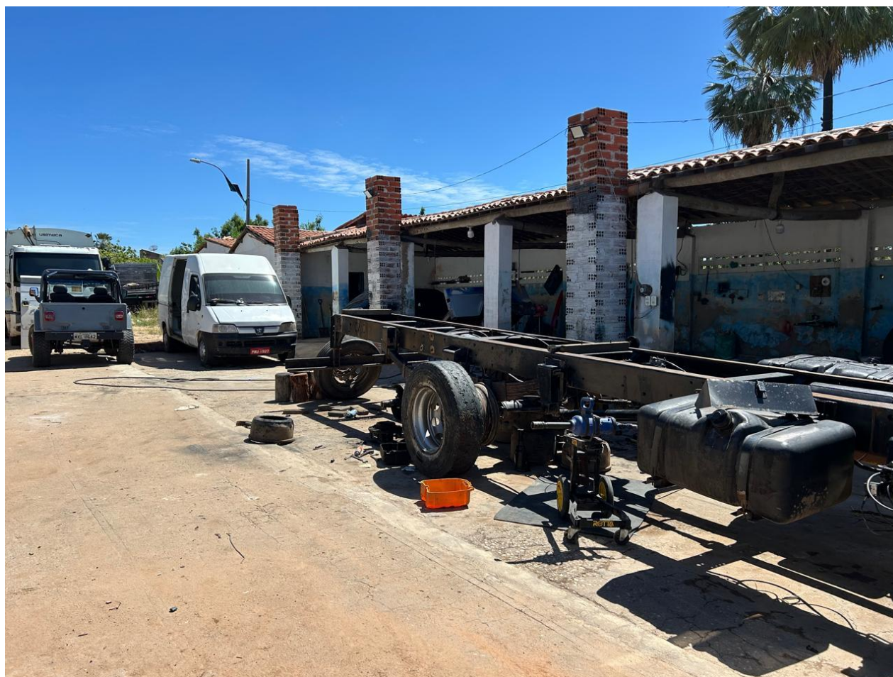
Imagem 03 – Visão geral parte interna (Oficina/Galpão) da sede da empresa (Endereço: Não foi repassado pelo responsável da empresa) – Data Visita: 03/07/2025

CNPJ Nº 07.963.515/0001-36 | CGF Nº 06.920.307-5