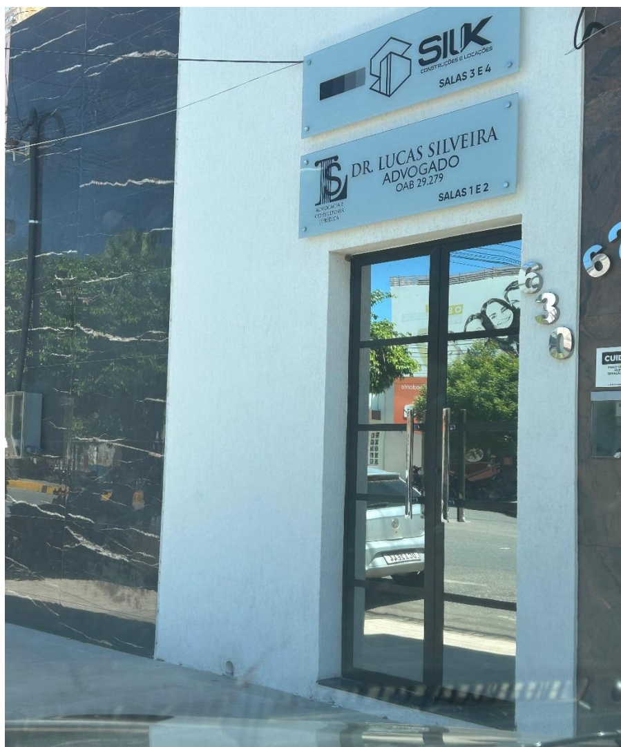
Imagem 01 - Fachada da empresa/sede visitada Endereço: Av. Dom Lino, 630, centro, Russas/CE – Data Visita: 03/07/2025

RELATORIO DA ESTRUTURA FÍSICA DA EMPRESA ENDEREÇO CONSTATADA NO CNPJ E CONTRATO SOCIAL.