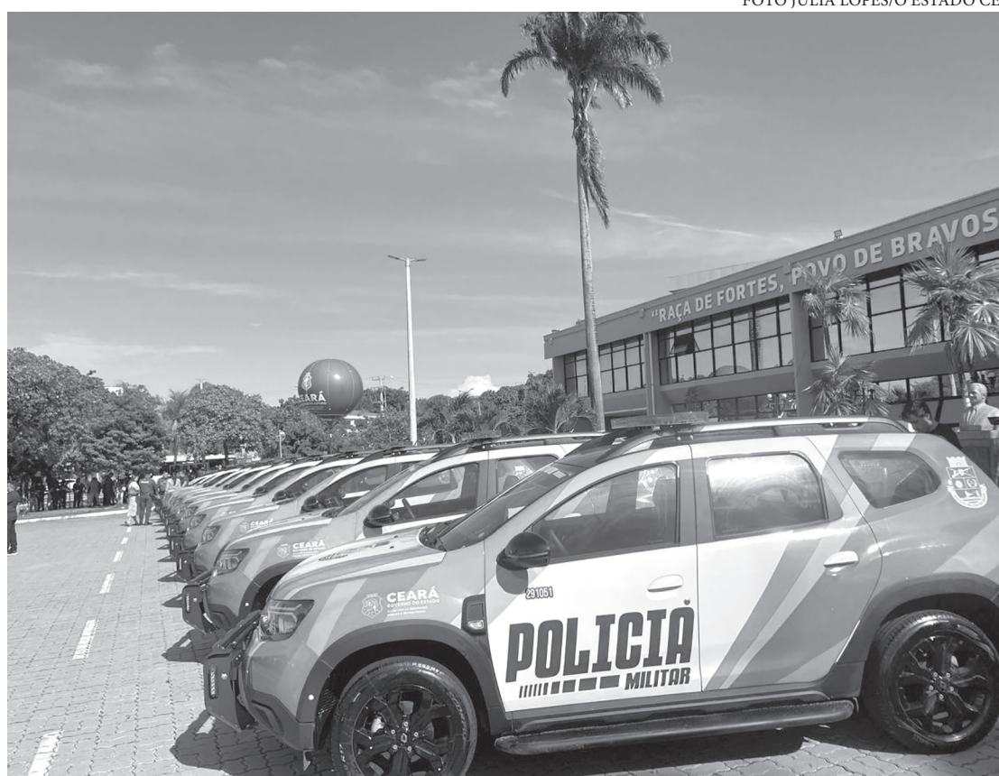
As 72 viaturas estão divididas em 12 veículos do modelo Jeep Commander e 60 Renault Duster

Durante coletiva, Elmano declara que os novos veículos contribuem para melhoria do trabalho da PMCE, tanto para maior capacidade de pronta resposta quanto para chegar mais rápido ao local da ocorrência. “Isso representa melhores condições de trabalho para a nossa