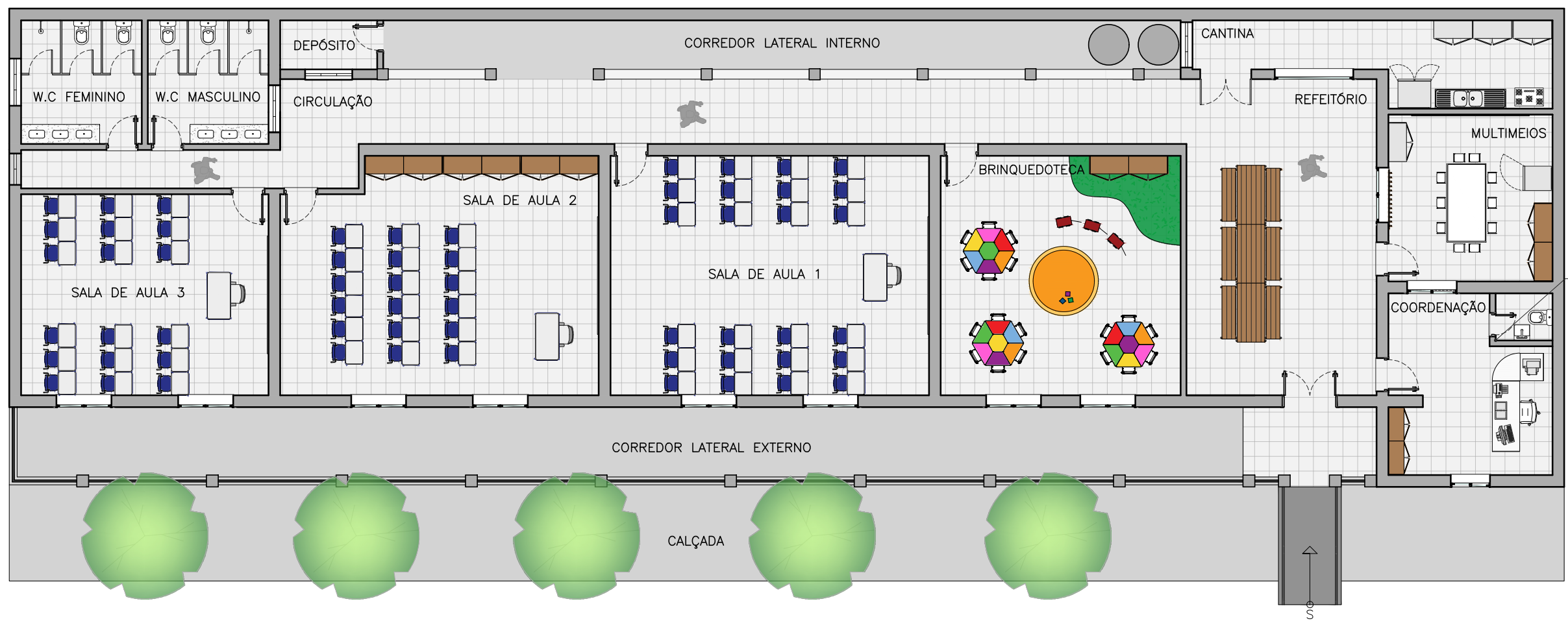
PLANTA DE LAYOUT – PROPOSTA ESC. 1:125

WARNEY PEREIRA RABELO:99578778368 Assinado de forma digital por WARNEY PEREIRA RABELO:99578778368