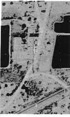
IMAGEM DE SATELITIZADAÇÃO DO IMÓVEL