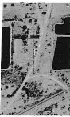
IMAGEM DE SATÉLITE LOCALIZAÇÃO DO IMÓVEL