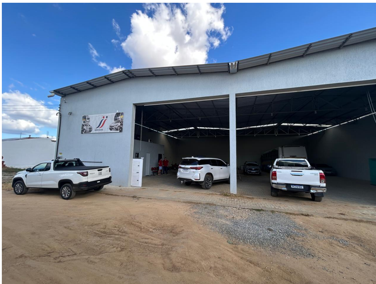
Imagem 01 - Rua Antônio Macedo Ximenes, nº 529, Bairro Barro Vermelho, Reriutaba/CE CEP: 62.260-000 – Data Visita: 24/07/2025

CNPJ Nº 07.963.515/0001-36 | CGF Nº 06.920.307-5