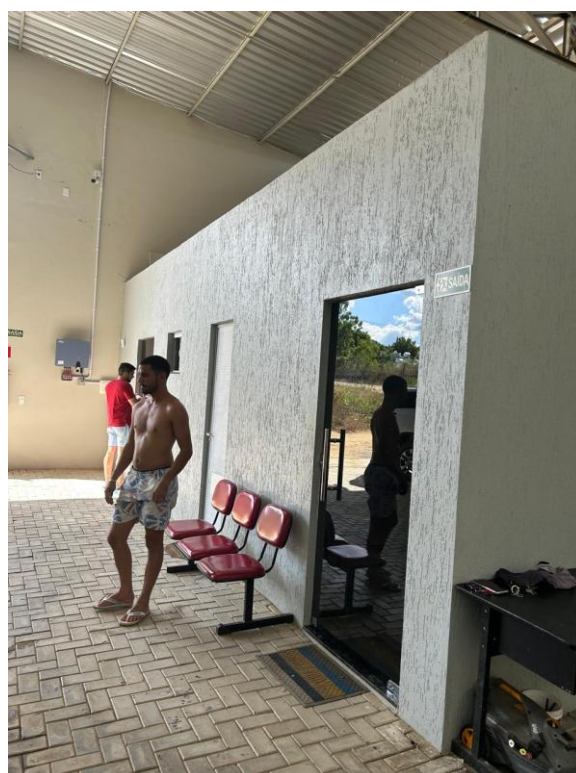
Imagem 02 e 03 – Visão geral parte interna (Recepção) da sede da empresa (Endereço: Rua Antônio Macedo Ximenes, nº 529, Bairro Barro Vermelho, Reriutaba/CE, CEP: 62.260-000) – Data Visita: 24/07/2025

CNPJ Nº 07.963.515/0001-36 | CGF Nº 06.920.307-5