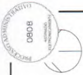
QUADRO DE ESQUADRIAS