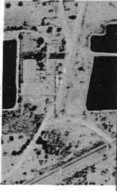
IMAGEM DE AEROFOTOGRAFIA DO LOCAL