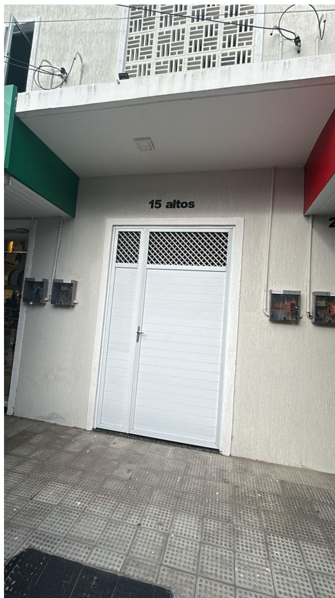
Imagem 03 - Visão geral parte externa da sede da empresa – (Av. João Jaime Ferreira Gomes, nº 015, Altos, Centro, Acaraú – CE) – Data Visita: 30/07/2025

As imagens acima foram registradas durante a diligência para comprovação das condições estruturais e operacionais da empresa.