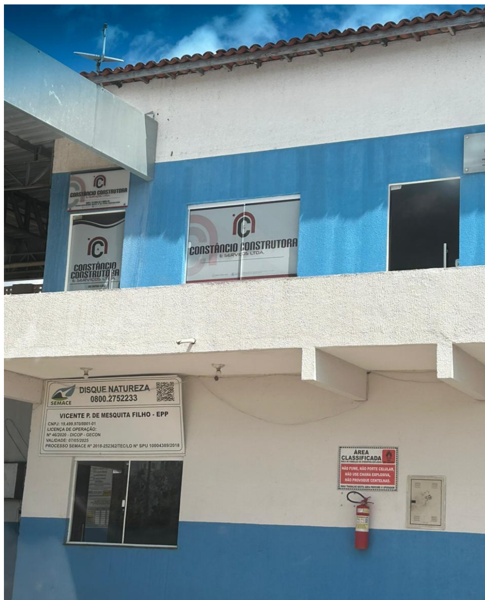
Imagem 01 - Av. Santo Antônio, Sala 02, nº 487, Centro, Reriutaba/CE, CEP: 62.260-000 – Data Visita: 21/07/2025

CNPJ Nº 07.963.515/0001-36 | CGF Nº 06.920.307-5