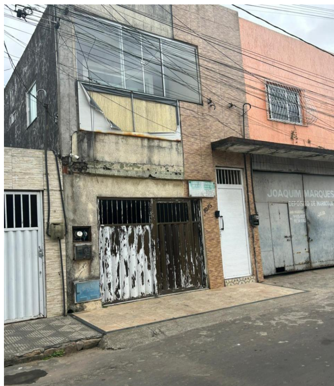
Imagem 01 e 02 – Fachada da empresa/sede visitada (Rua Capitão Carapeba, nº 1015, Apartamento, Centro, São Benedito/CE - CEP: 62.370-000) – Data Visita: 21/07/2025

CNPJ Nº 07.963.515/0001-36 | CGF Nº 06.920.307-5