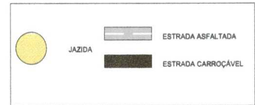
PLANTA DE INDICAÇÃO DE JAZIDA 02 1:200