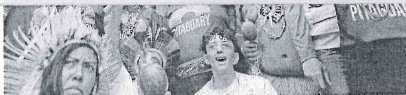
INSTALAÇÃO dos marcos nos municípios de Maracanaú e Pacatuba