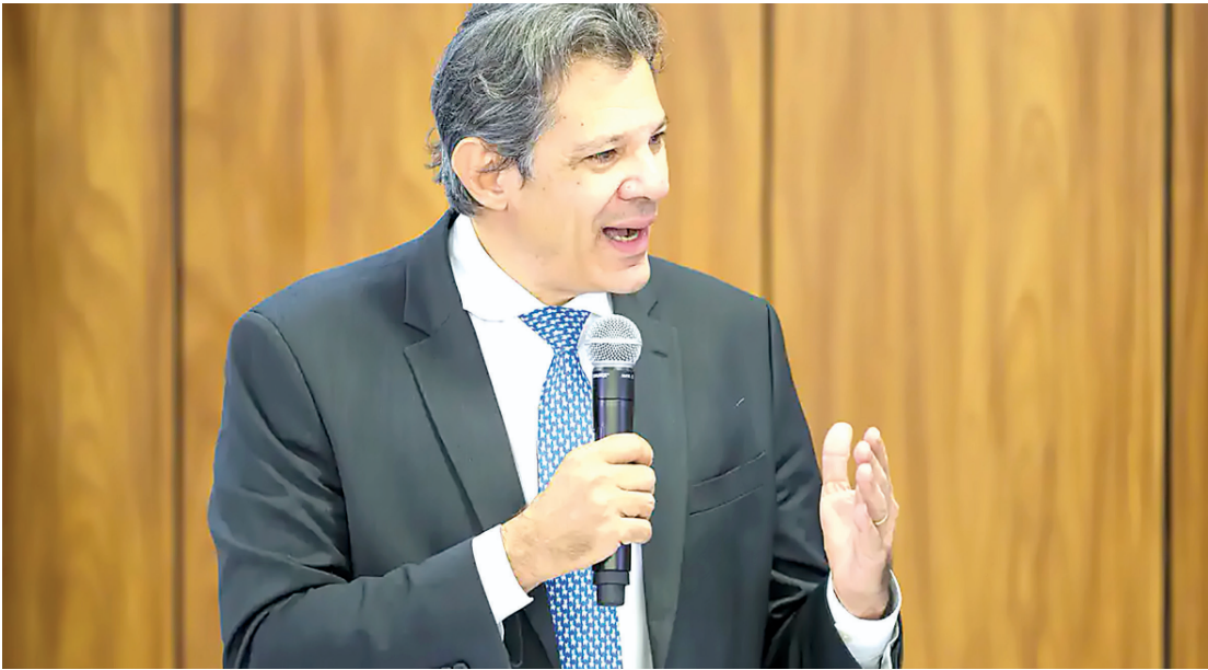
O ministro disse também que a MP vai prever uma cobrança por manutenção de empregos

Para tentar amenizar os impactos do tarifaço sobre as empresas, o governo de Luiz Inácio Lula da Silva (PT) prepara um pacote de medidas, que deve incluir linhas de crédito e o diferimento de tributos (um prazo adicional para que as companhias efetuem o pagamento dos impostos). Haddad disse ainda que a MP (medida provisória) vai incluir uma reformulação no FGE (Fundo de Garantia à Exportação), criado para cobrir riscos em operações de crédito a vendas ao exterior. “Além de medidas conjunturais de apoio aos exportadores que vão estar em situação de dificuldade, vamos fazer uma coisa mais estrutural”, afirmou o ministro. “Nós estamos fazendo uma reforma estrutural no FGE, com o suporte dos demais fundos, para garantir que não só os grandes, mas toda empresa brasileira que tiver vocação de exportação vai ter instrumentos modernos para fomentar a exportação para o mundo inteiro. Porque muitas das exportações brasileiras vão ter que mudar de destino.” Segundo ele, a estratégia brasileira é buscar novos mercados para as empresas que hoje dependem das exportações aos Estados Unidos e ficarão prejudicadas pela sobretaxa. O ministro disse também que a MP vai prever, em alguma medida, uma cobrança por manutenção de empregos para empresas que acessarem o socorro. A exigência, porém, terá previ-