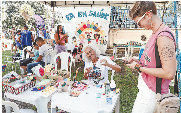
Ação teve programação gratuita com shows de artistas e estandes educativos