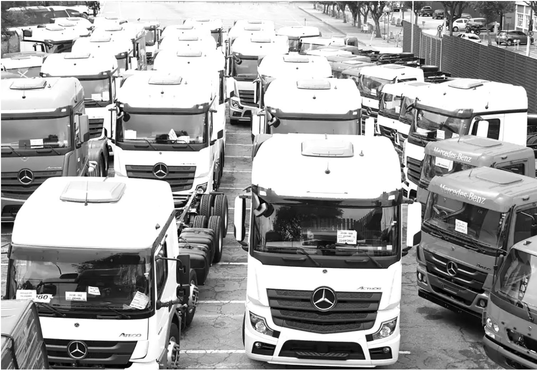
O limite de financiamento será de até R$ 50 milhões por usuário do programa

O Governo do Brasil lançou oficialmente, nesta quinta-feira (8), o programa Move Brasil, uma iniciativa voltada à renovação da frota nacional de caminhões, com foco em eficiência logística, segurança viária e sustentabilidade ambiental. O programa oferece linhas de financiamento com taxas de juros reduzidas para caminhoneiros autônomos, cooperativados e empresas de transporte rodoviário de cargas, priorizando a aquisição de veículos que atendam a critérios de sustentabilidade e de conteúdo local.