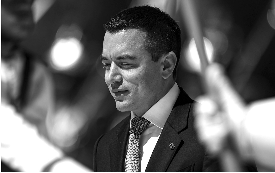
Noboa decretou a medida, que vale por 60 dias, em sete das 24 províncias do onde há focos de protestos

Noboa também resolveu suspender a liberdade de reunião nas sete províncias e autorizou as forças policiais e militares a “impedir e desarticular reuniões em espaços públicos onde se identifiquem ameaças à segurança cidadã”.