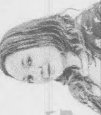
ESTA COLUNA É PUBLICADA AS SEGUNDAS