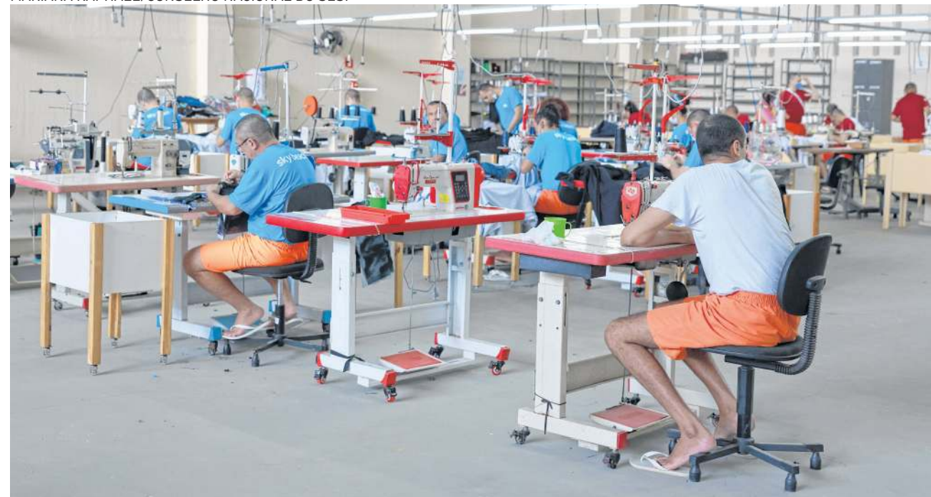
CEARÁ é destaque em projeto de formação educacional e profissional de internos do sistema prisional