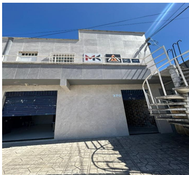
Imagem 01 e 02 - Visão geral parte externa da sede da empresa – (AV. Zenobio Leandro Evangelista, 370, sala 02, Eusébio/CE, CEP: 61.761-680) – Data Visita: 25/07/2025