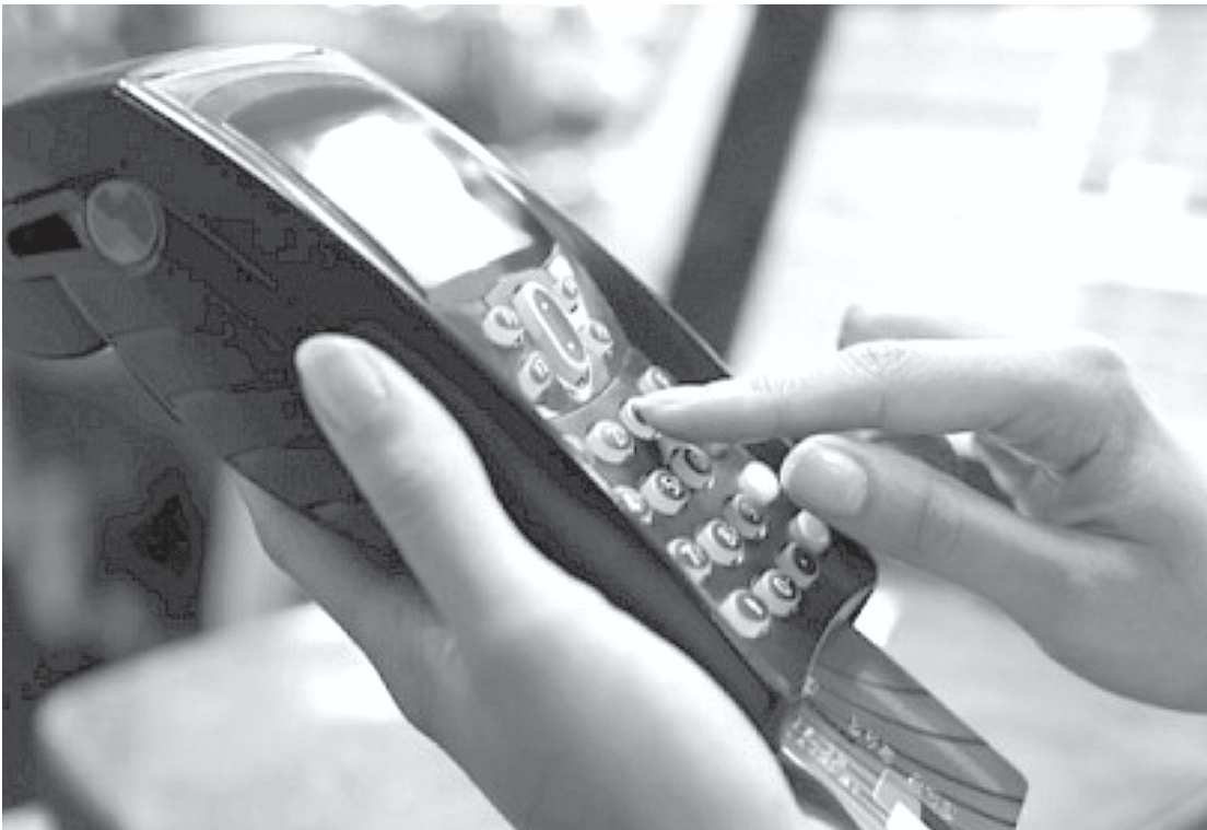
O cartão de crédito manteve-se como a principal modalidade de dívida

Apesar da melhora no último trimestre, o balanço anual revela um cenário mais desafiador do que o observado