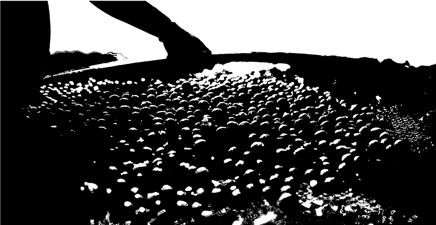
De janeiro a agosto, as vendas no varejo caíram 5,41% ante igual período de 2024

Com ambiente externo, o segmento acompanha as incertezas sobre tarifas aplicadas pelos Estados Unidos, principal destino do café brasileiro