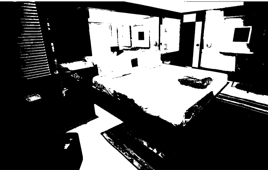
Segundo a Abih, as mudanças não impactarão nos preços da hotelaria

Ao explicitar que a diária corresponde a 24 horas